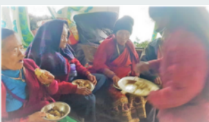
Les anciens ont fêté le nouvel an népalais mi-avril 2021. (année 2078)