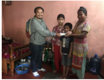
Famille de la didi

Voici quelques photos de la remise de la somme aux familles :