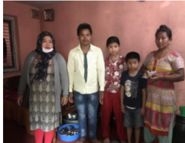
Famille de Ramit: