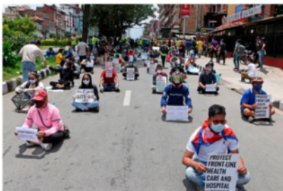
*Les manifestants qui maintiennent une distance sociale tiennent des pancartes lors d'une manifestation contre le gel des frontières par le gouvernement de la vallée contre la pandémie COVID-19, à Katmandou le 13 juin 2020.

Malgré le confinement, au mois de Juin, des manifestations ont eu lieu à Katmandu, les manifestants demandaient davantage de tests de dépistage, de meilleures infrastructures de quarantaine pour les migrants de retour de l'étranger et plus de transparence dans les dépenses du gouvernement.