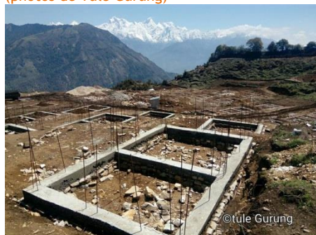
Fabrication des briques sur place

Les fondations du nouveau village